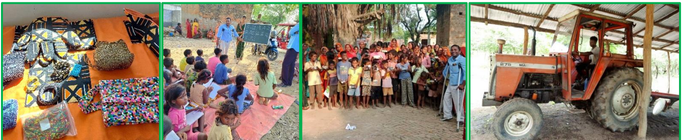
Créations des sourds-muets