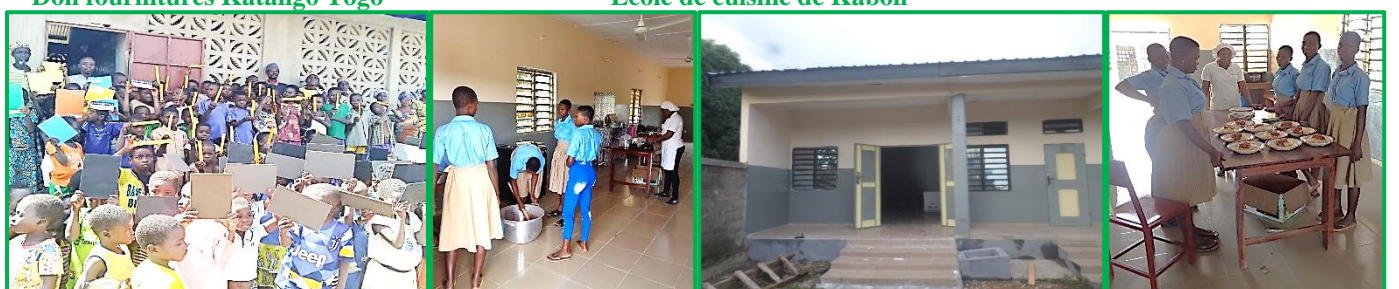
Ecole de cuisine de Kaboli