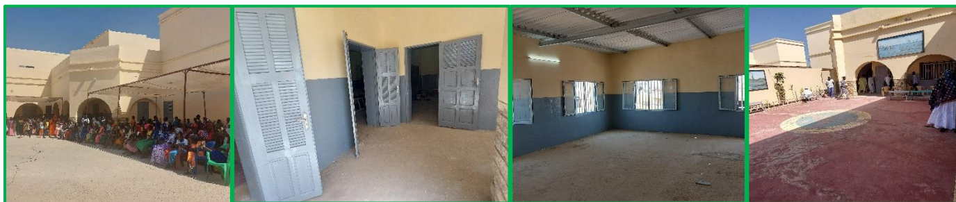
Maternelle Cheikh Touré

De 450 élèves qui avaient pu poursuivre leur scolarité, sur plus de 1100 antérieurement, l'effectif a déjà pu revenir à près de 900. FIDEI va faire restaurer par les apprentis ébénistes du centre des sourds-muets une centaine de « tables-bancs ». La salle de l'équipe pédagogique sera équipée de 4 ordinateurs portables. La cour de récréation sera réaménagée pour encourager la pratique sportive. De nouvelles installations sanitaires ont été créées. Les parents d'élèves, le comité de gestion de l'école et les élèves eux mêmes ont exprimé de très chaleureux remerciements à tous les donateurs.