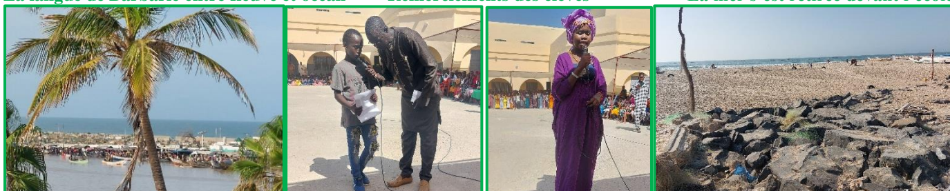
La mer s'est retirée devant l'école