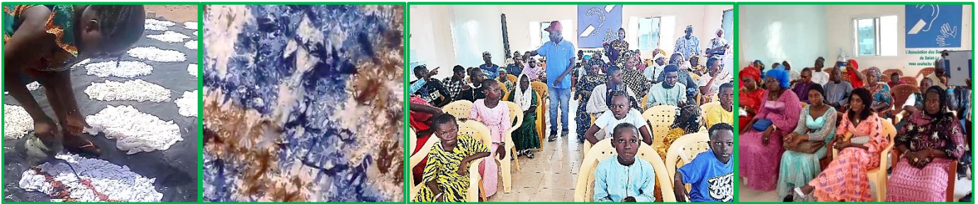
Impressions à la cire : Batik

Centre Teeltaaba des veuves de Koubri : les veuves de Koubri au Burkina ont élargi l'éventail de leurs activités génératrices de revenus et se sont formées à la teinture à la cire pour la production de Batik et à la fabrication de savon. L'équilibre financier du centre repose largement sur le fonctionnement de la minoterie, louée à un meunier local qui prend en charge les frais d'électricité et verse un loyer mensuel.