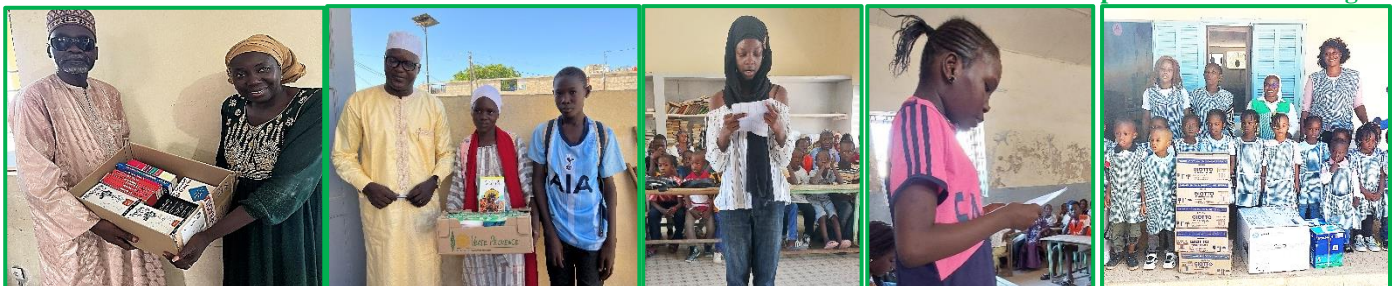
Imprimante et craies Dagana

Au Sénégal 3000 élèves ont reçu de FIDEI les fournitures scolaires indispensables pour le premier trimestre 2024. A Dagana une imprimante et des craies ont été remises à l'école maternelle. A Damando au Togo , l'école primaire la plus isolée de tous les établissements construits par FIDEI a reçu des Soeurs de STV un lot de fournitures en récompense de la réussite de 100% des élèves de CM2 à l'examen de fin d'études primaires.