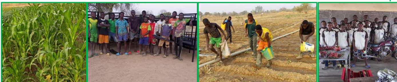
Ecole de mécanique