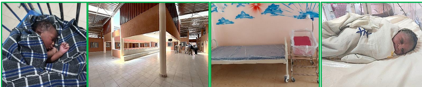
Guet-Ndarien âgé d'une heure

A Ndar Toute et à Guet-Ndar FIDEI a remis des médicaments et des vêtements. A Dagana un microscope et deux tensiomètres ont été offerts au dispensaire des Soeurs spiritaines qui accueille tous les matins jusqu'à 80 malades dont beaucoup arrivent de très loin, notamment les familles peules nomades.