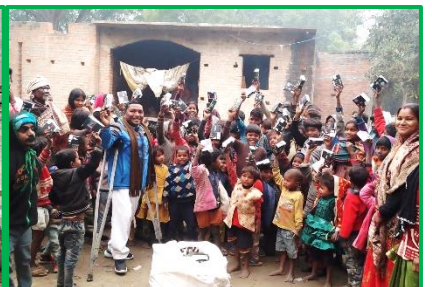
Distribution de nourriture et de vêtements à Baniywa Ayar, Inde

FIDEI adresse ses remerciements au cercle de ses amis donateurs privés et à tous ses partenaires. Pour 2023/2024, il s'agit des Fonds de Dotation La Valinière et dB'Human, des Fondations Lord Michelham of Hellingly, SPIE Batignolles, Impala Avenir, Agir sa Vie, des associations : Golf des Templiers, Le Bouquin Volant, Lunettes sans Frontière et du cabinet GEREP.