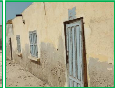
Etat des locaux restant à rénover

Le projet de réhabilitation complète de l'école Cheikh Touré de Guet-Ndar à Saint-Louis du Sénégal est entré dans sa dernière phase avec la mise en application de l'accord conclu avec la municipalité pour la démolition des bâtiments partiellement détruits par la montée des eaux et pour la construction d'un mur d'enceinte. Les travaux de remise en état par FIDEI des classes subsistantes seront achevés avant la rentrée scolaire d'octobre 2024. La commande de tous les éléments d'ébénisterie et de menuiserie métallique a été passée auprès des ateliers d'apprentissage du centre des sourds-muets de Pikine . Celui-ci constitue un lieu de rencontre pour la communauté éducative spécialisée dans l'enseignement du langage des signes. Un séminaire de « renforcement des capacités » de moniteurs et monitrices venus de tout le pays s'y est tenu au mois de janvier 2024.