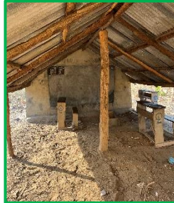
Une classe d'Afélé