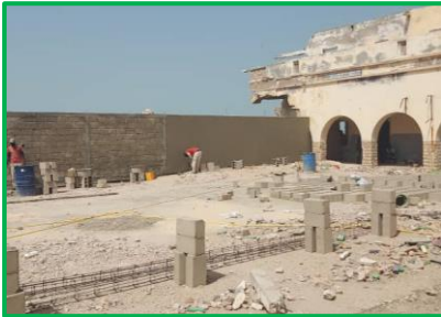
Travaux en cours à l'école Cheikh Touré de Guet-Ndar