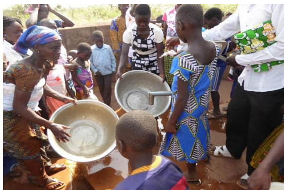
Forage de Damando

Le projet approuvé en décembre 2016 portant sur l'accès à l'eau, à la scolarisation et aux soins dans le secteur de Bitchabé, région de Kara, au Togo a atteint sa phase finale avec la construction de l'école maternelle et du dispensaire de Kountoum dont le gros-œuvre est terminé et les finitions en voie d'achèvement. Comme indiqué dans le rapport intermédiaire, le programme de forages : Damando, Taouleba, Kountoum, a été achevé de même que l'école maternelle de Bitchabé. Cet été, de jeunes volontaires franciliens sont venus décorer les classes et le préau de cette école destinée à la petite enfance. A cette occasion ils ont pu également donner des cours de soutien à de jeunes écoliers et apporter fournitures scolaires et dictionnaires pour le collège situé dans le même village.