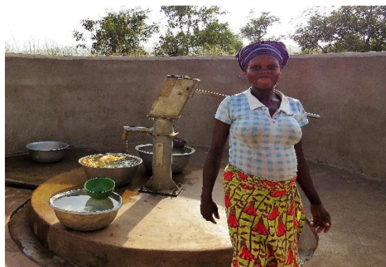
Forage de Kountoum