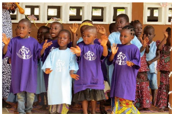
Enfants de maternelle et école de Bitchabé