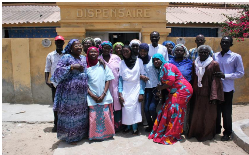
Equipe médicale et comité de santé de Ndar Toute