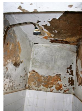
Etat de délabrement 2016