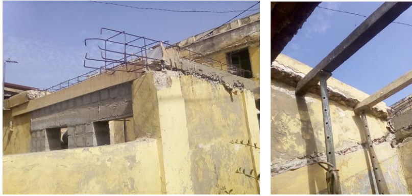
Construction des toilettes et pose de la nouvelle toiture