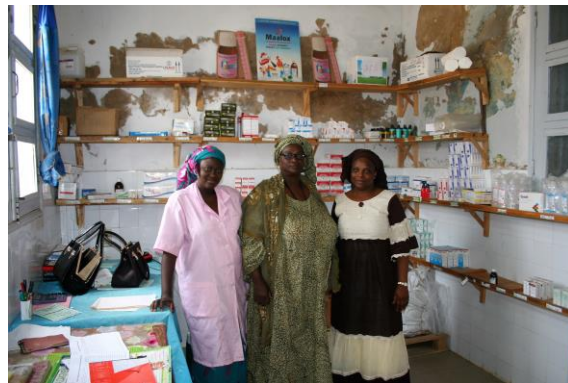
Etat de la pharmacie avant la 2° rénovation