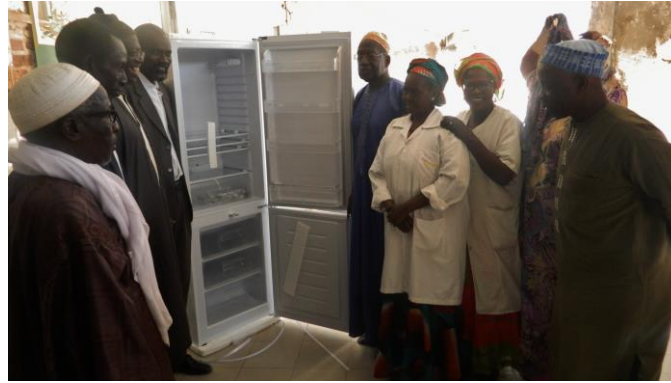
Remise du réfrigérateur