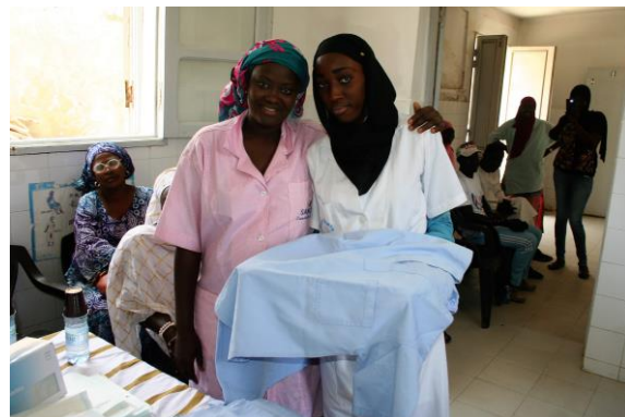
Remise de blouses et produits pharmaceutiques après la 1 o rénovation