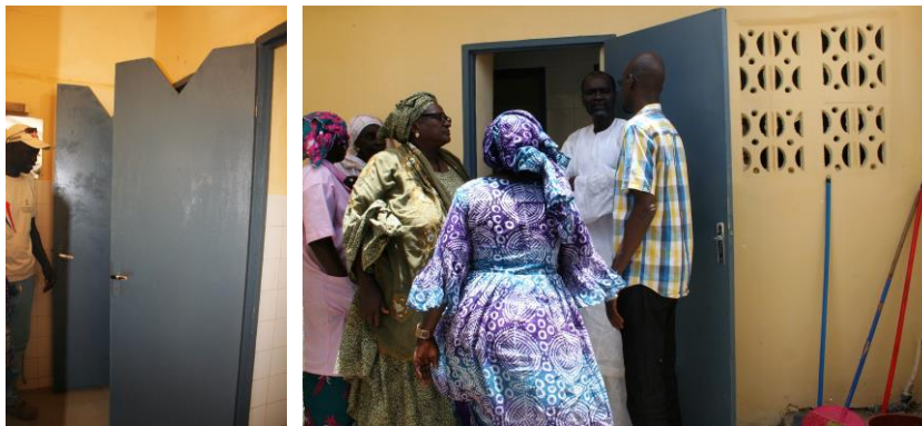
Les nouvelles installations sanitaires