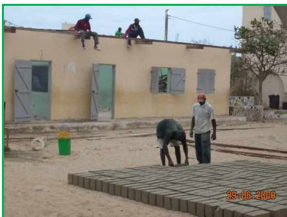
Le bâtiment en juin 2008 avant la surélévation

180 enfants de 3 à 5 ans sont scolarisés dans la nouvelle école; l'Etat Sénégalais a fourni les équipements et nommé 4 institutrices confirmées ; 3 assistantes maternelles ont été choisies et prises en charge par les parents d'élèves.