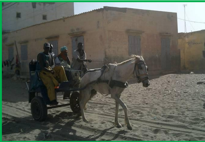
Anciennes salles de classes en cours de démolition

Les plans approuvés par FIDEI et par les bénéficiaires prévoient 2 salles de classes de 90m 2 au 1 o étage qui abriteront 100 élèves et 2 salles polyvalentes modulables au rez-de-chaussée qui accueilleront les associations et groupements à caractère économique et social, une école de couture, des cours d'alphabétisation et de soutien scolaire et des sessions de sensibilisation et de formation à l'environnement, l'hygiène, et la vie familiale.