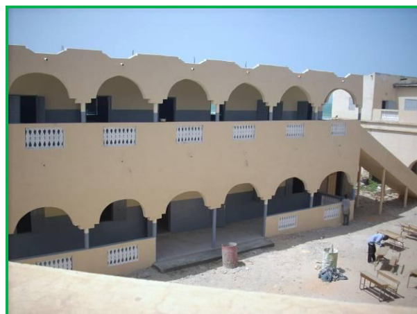
Le bâtiment en octobre 2008 rénové et surélevé

2 classes de CM2 se trouvent dans des locaux provisoires dans l'attente de la construction du centre socio-éducatif dont le chantier a été ouvert cette semaine.