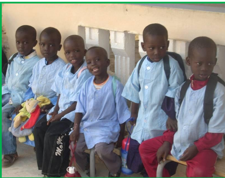
Les écoliers portent les tabliers confectionnés à l'école de couture

FIDEI a doté l'école de couture de 5 machines électriques ; 10 autres seront acheminées aux mois de mars et juillet ; les couturières ont confectionné les tabliers pour les enfants de la maternelle. En contrepartie de la mise à disposition des locaux et du matériel elles dispenseront des cours de couture aux élèves des classes de cours moyen et de cours élémentaire de l'école Cheikh Touré.