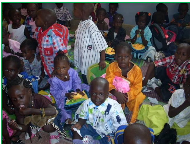
L'ouverture de la maternelle: jour de fête pour les enfants

2 classes de CM2 se trouvent dans des locaux provisoires dans l'attente de la construction du centre socio-éducatif dont le chantier a été ouvert cette semaine.