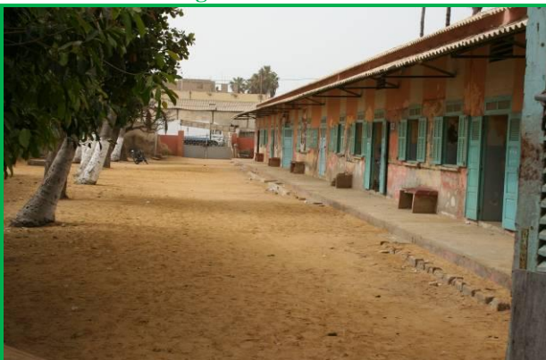
Futur collège Samba Ndieme