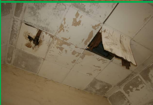
Le plafond d'une classe de l'école Dodds