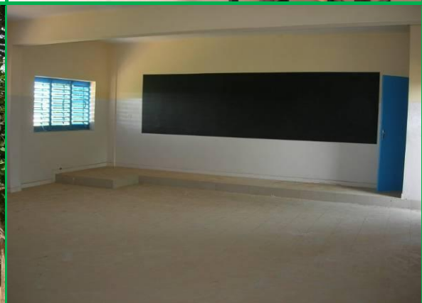
Ecole Gabriel Deshayes Richard Toll : l'extension