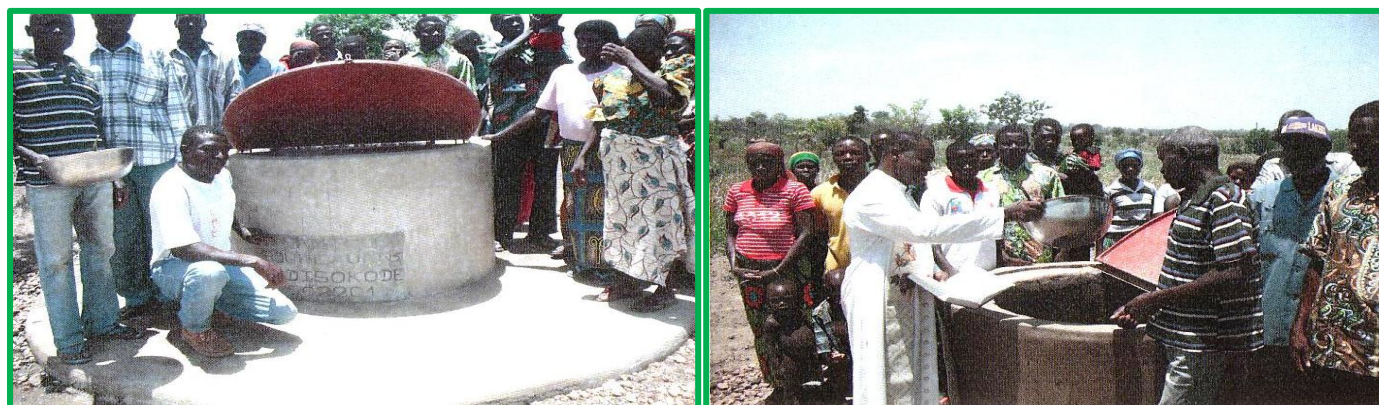
Célébration de la mise en fonctionnement du 3° puits

Après ceux des villages de Rogbi et Fifidjo, les 4000 habitants de Souroutawi dans le canton de Koussountou au Togo ont dorénavant accès à ce bien précieux qu'est l'eau potable. Un don spécifique reçu par FIDEI a permis le creusement de ce 3° puits réalisé avec la participation active de la population locale.