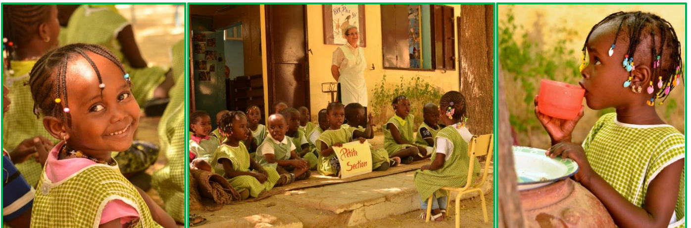
Enfants de l'école maternelle de la Mission de Dagana

L'école maternelle de la Mission de Dagana s'est agrandie, passant d'une à trois salles de classes. FIDEI a pu apporter de nouvelles poupées Corolle offertes par la société Mattel, des jeux éducatifs, du matériel de travaux manuels, et des médicaments, layette et vêtements pour le dispensaire.