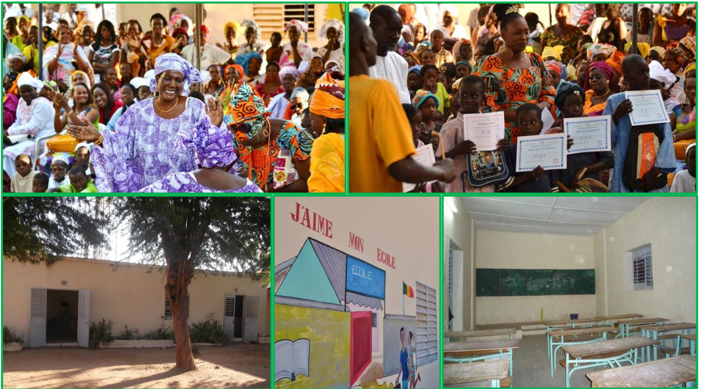
Fête de l'excellence et inauguration de l'école AB Sall rénovée