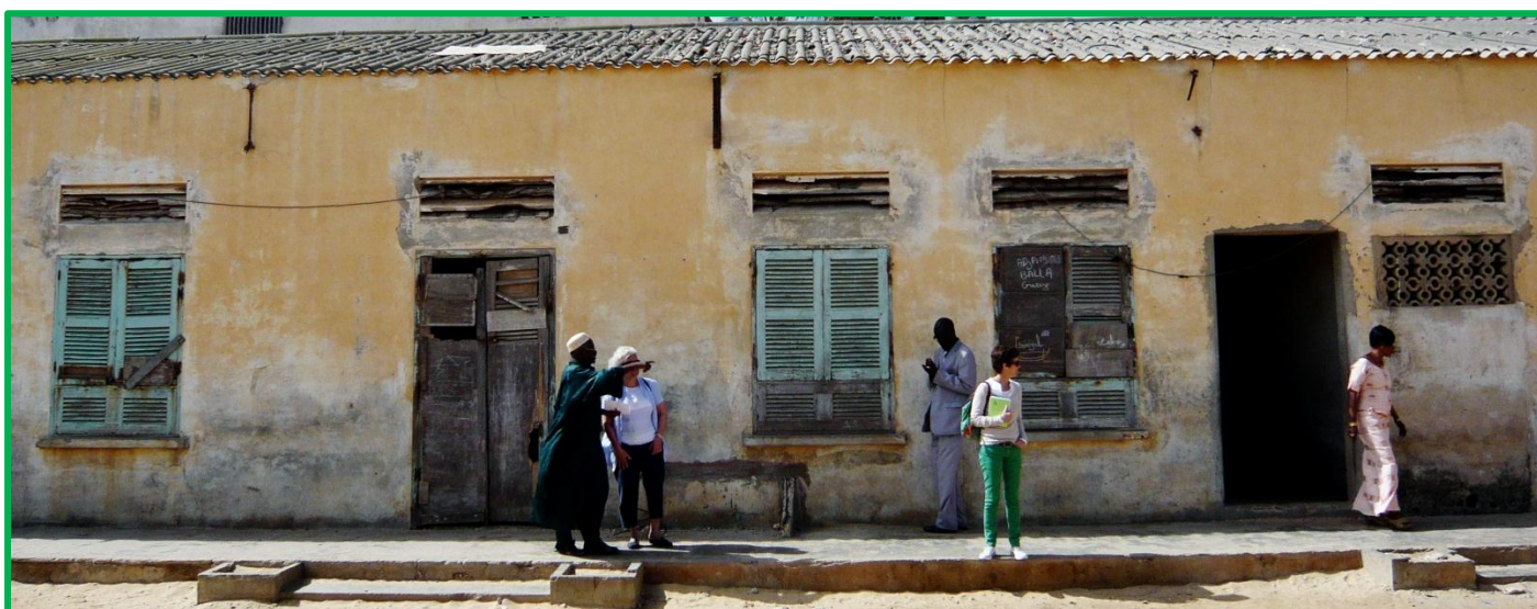
Etat actuel de 3 des futures salles de classes de l'école maternelle

Afin de compléter le nouvel ensemble scolaire de Ndar Toute qui accueillera 1400 élèves, il est apparu indispensable de créer une école maternelle. Le quartier en est privé alors que plusieurs milliers d'enfants attendent d'être scolarisés. FIDEI s'est engagée à la construire à l'arrière du collège, avec un accès séparé et une grande cour de récréation sécurisée. 3 anciennes salles de classes actuellement fermées pour raisons de sécurité seront profondément restructurées. Une 4° salle de classe, une cantine, un bureau administratif, un logement de gardien et des sanitaires seront construits après démolition de bâtiments vétustes. Le coût de l'opération s'élève à 50 000€.