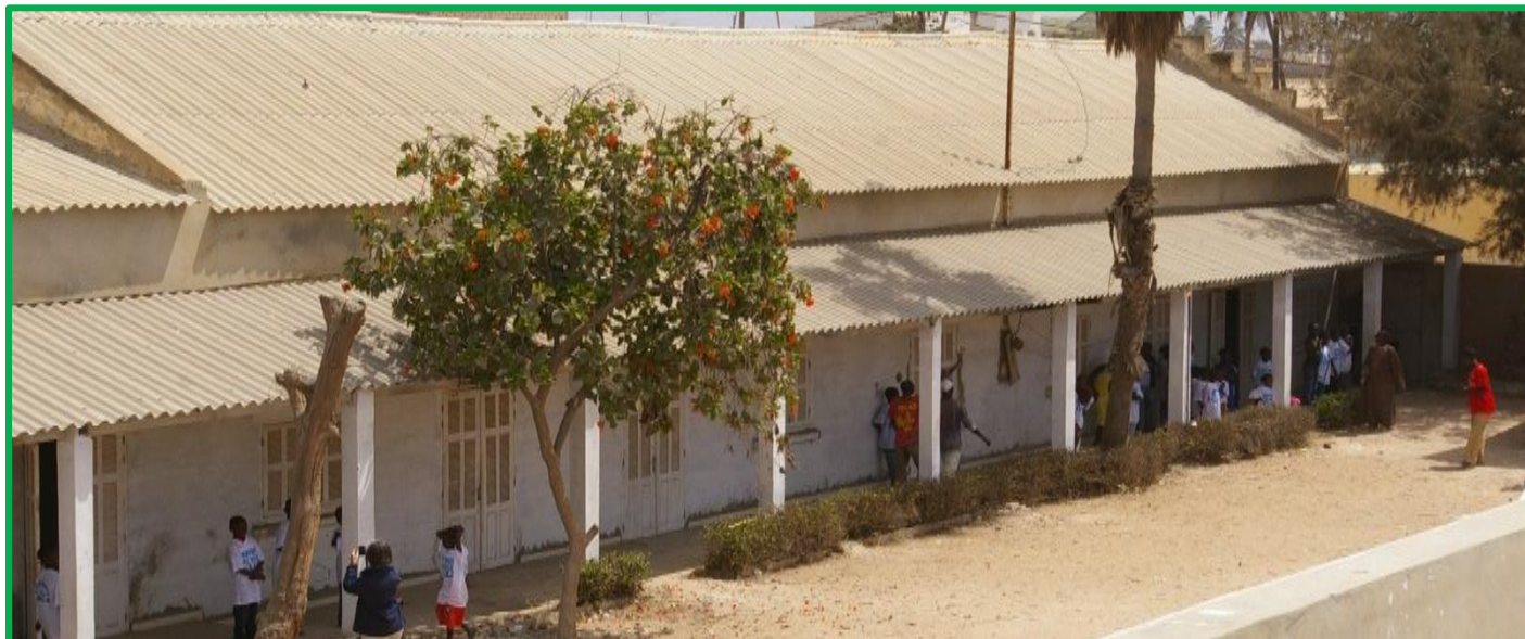
Le bâtiment nord de l'école Dodds rénové

La rénovation des 6 classes du bâtiment nord de l'école Dodds achevée, FIDEI a entrepris la construction de 5 classes neuves, d'une vaste médiathèque qui sera ouverte à tous les habitants du quartier, d'un logement de gardien et de sanitaires. Cet ensemble a été inauguré le 22 mars. Les futurs élèves, le corps enseignant et les autorités locales ont exprimé leur profonde satisfaction lors d'une cérémonie remarquable regroupant élèves, parents, équipe pédagogique, et autorités locales.