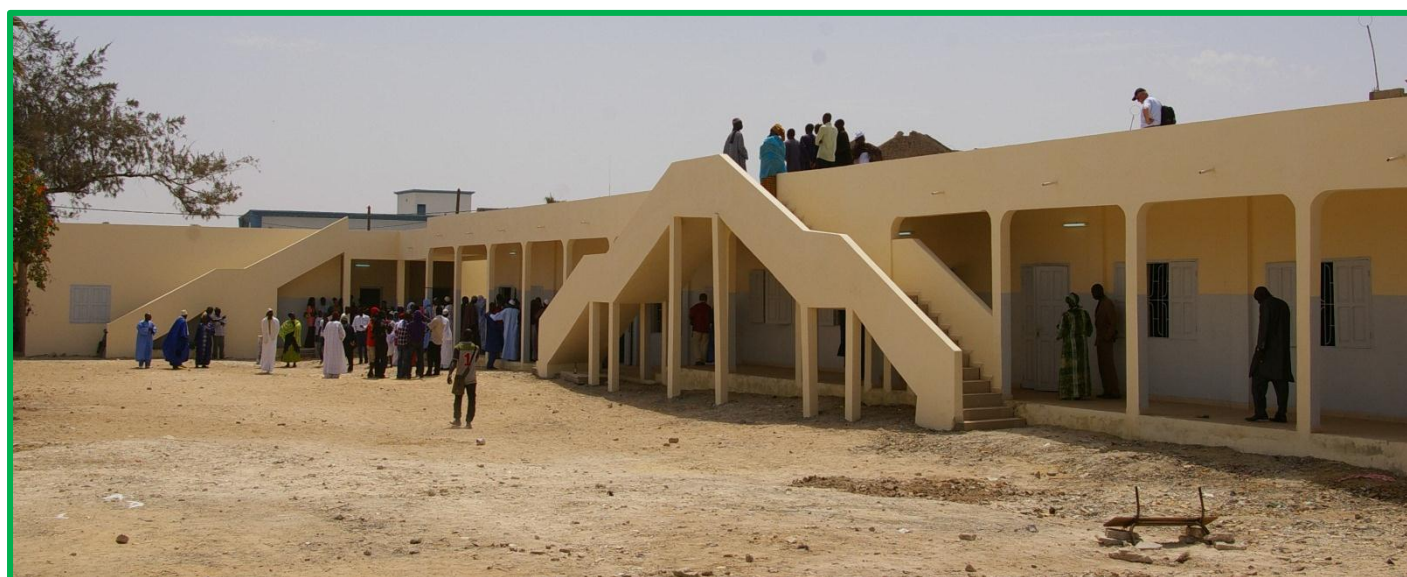
Les constructions nouvelles de l'école Dodds