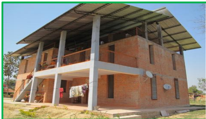
La Maison Communautaire « Karuna Bhavan*»

La maison communautaire construite avec le soutien des Fondations Abbé Pierre, GODF, Kiran et celui de FIDEI est opérationnelle et abrite au rez de chaussée de jeunes adultes handicapés, entourés de 2 familles occupant l'étage supérieur. Ce nouvel exemple d'intégration sociale permet d'assurer l'avenir de personnes dépendantes accueillies à Kiran depuis leur enfance. Après avoir complété l'équipement informatique du Centre de Formation Kiran pour éducateurs et physiothérapeutes spécialisés, FIDEI prévoit de fournir le matériel informatique et audio-visuel destiné à une salle multimédia en cours de construction au sein du futur collège du village de Kiran.