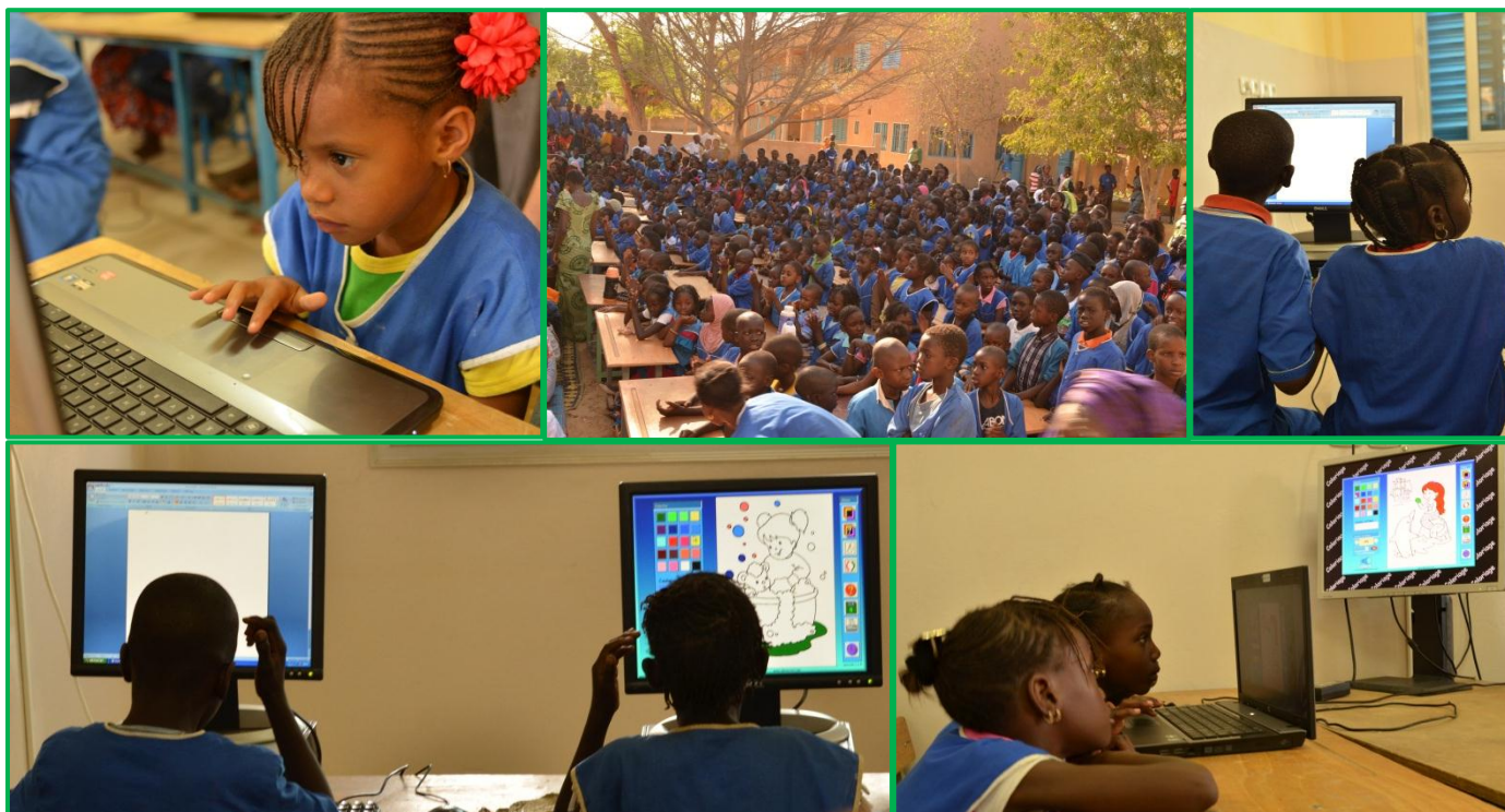
Elèves de l'école Gabriel Deshayes