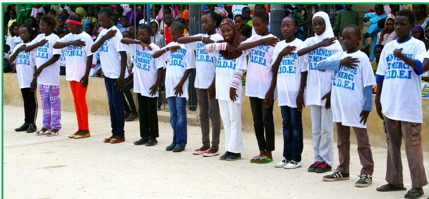
Bienvenue et Merci FIDEI

La rénovation des 6 classes du bâtiment nord de l'école Dodds achevée, FIDEI a entrepris la construction de 5 classes neuves, d'une vaste médiathèque qui sera ouverte à tous les habitants du quartier, d'un logement de gardien et de sanitaires. Cet ensemble a été inauguré le 22 mars. Les futurs élèves, le corps enseignant et les autorités locales ont exprimé leur profonde satisfaction lors d'une cérémonie remarquable regroupant élèves, parents, équipe pédagogique, et autorités locales.