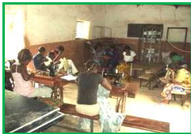
Les locaux actuels

Pour assurer l'insertion économique de jeunes filles une première initiative de formation à la couture avait été mise en place à Koubri puis soutenue par FIDEI avec un don de machines à coudre. Elle se déroule dans des locaux loués, ouverts aux intempéries, inadaptés.