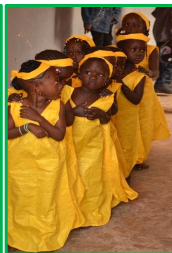
Danseuses de maternelle

Pour célébrer la 10° année de son soutien à l'école Cheikh Touré, FIDEI lui a remis des ordinateurs portables et des claviers afin de renouveler l'équipement de la salle informatique, des livres et des armoires, des djembés, nattes et chaises et un toboggan pour la maternelle, et a décerné aux élèves les plus méritants des prix composés de cahiers, stylos, crayons de couleurs et matériel de dessin lors d'une cérémonie des plus conviviales. 8 étudiants bénévoles de TelecomParistech assureront des formations à l'informatique au mois de juillet.