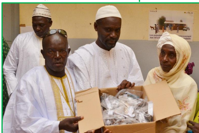
Remise de lunettes au dispensaire