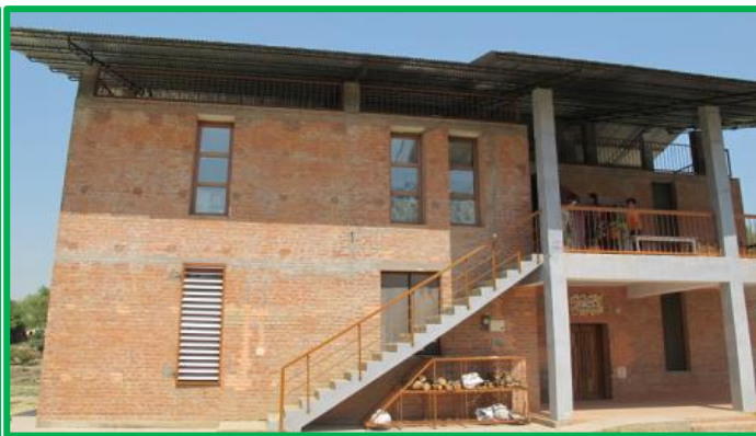
* « La Compassion »