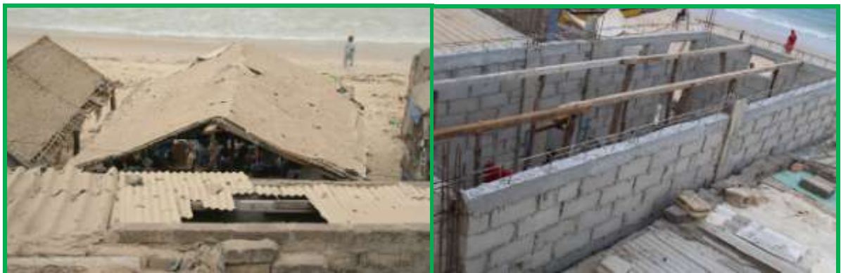
Chantier toilettes Daak